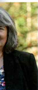
Dupré Fct publique