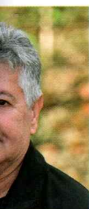
Ald-Tayeb Transport Deau